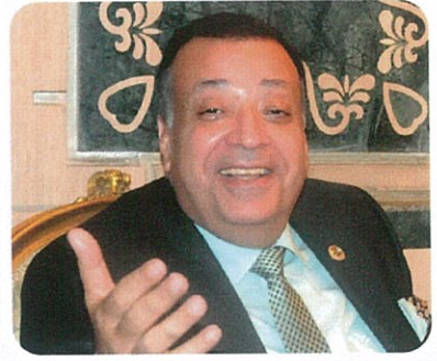
الدكتور محمد سعد الدين : شعب مصر السند الأول للرئيس السياسي