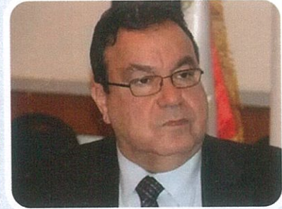
اتحاد الصناعات: إعادة إعمار غزة يحتاج لتدخل دول.. وشركات مصر جاهزة