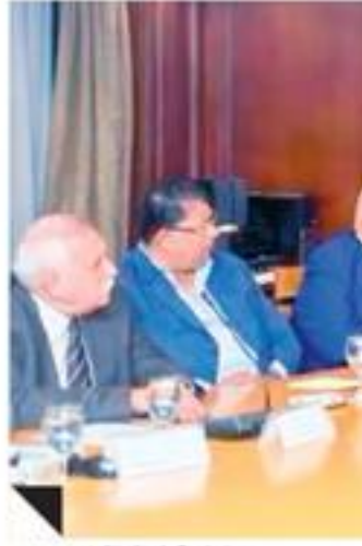
اجتماع اتحاد المستثمرين