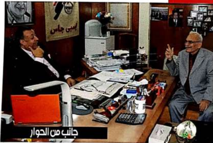
جانب من الحوار

ولكن مصاريف هذه المدارس عاليه ؟ نعم لأن جوده التعليم في