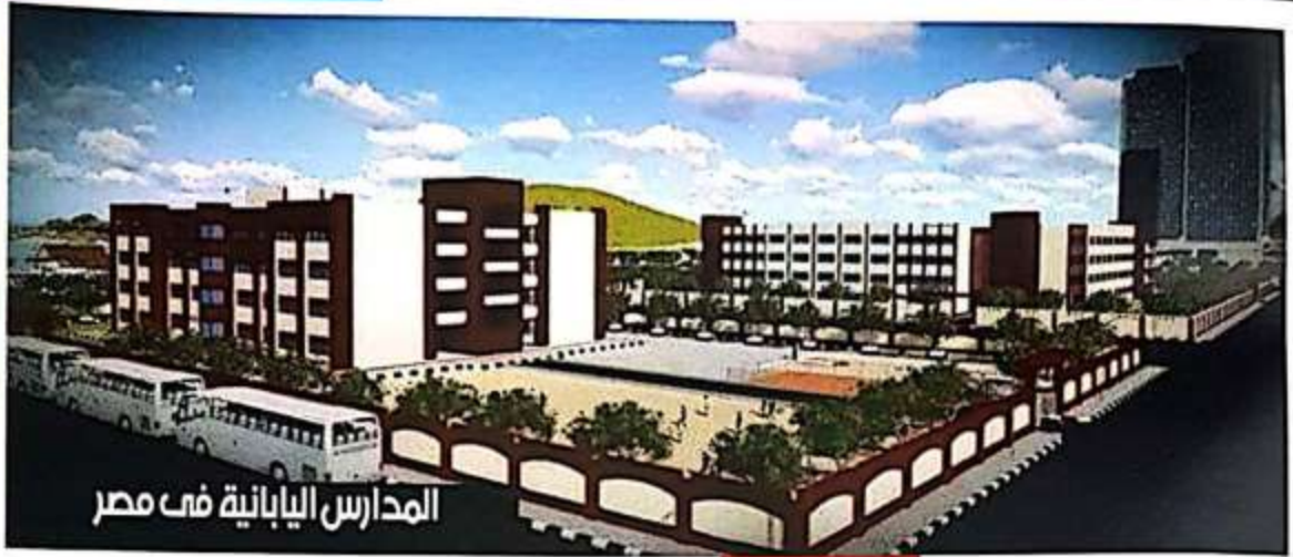
المدارس اليابانية في مصر

والفزياء والكيمياء والهندسة والطب هي المطلوبة في عصر التكنولوجيا الذي نعيشه الآن واصبح البحث العلمي القائم علي التجارب العملية في المعامل هو الاساس في الجامعات العالميه وهو الذي يؤدي الي كل الاكتشافات العلميه التي يميز بها العصر الحديث . لذلك يجب وضع استراتيجيه تتبني زياده الكليات العملية وتزويدها بكل ما يلزمها من معامل ووسائل البحث العلمي الحديث من خلال ربطها بالجامعات الكبرى في العالم وذلك علي حساب الكليات النظرية لاننا في حاجه الي علماء ودارسين للرياضيات والفزياء اكثر من حاجتنا لدارسي الادب . حتي في التعليم قبل الجامعي يجب زياده الدارسين للمواد العلميه وزياده مواد التكنولوجيا والعلوم الحديثه وايضا التعليم الفني يجب اعاده النظر في المواد التي تدرس فيه وتزويده بأخر ما وصل اليه التعليم الفني في البلاد المتقدمه في