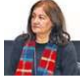
الفيلم القصير .. والفرصة الثانية