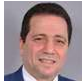
الفاقدون.. والرغيف المدعوم!!