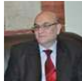
أئمة وخطباء منسيون.. يغردون خارج السرب!