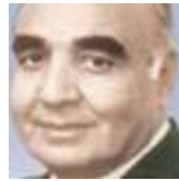
دفتر أحوال يوميات بالسويس