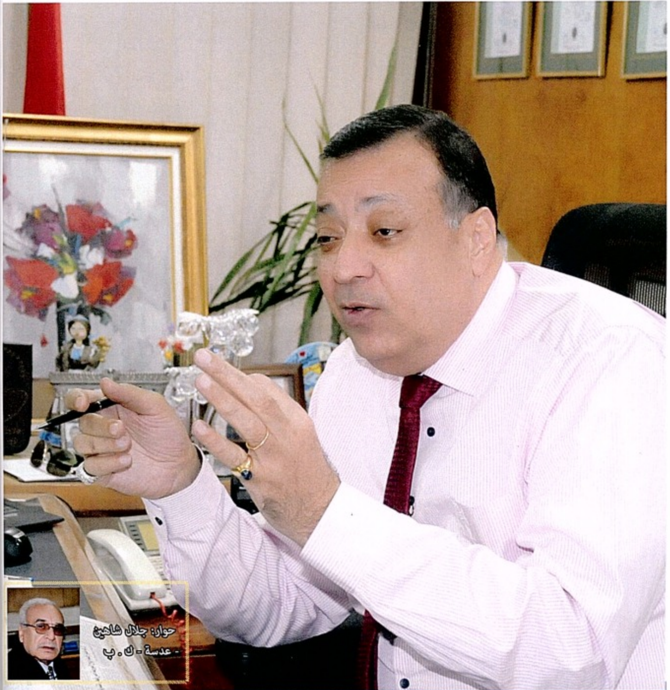
حوار: جلال شالبي